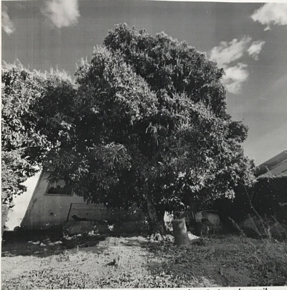
Figura 2. Raízes da árvore e trincamento da estrutura do canil